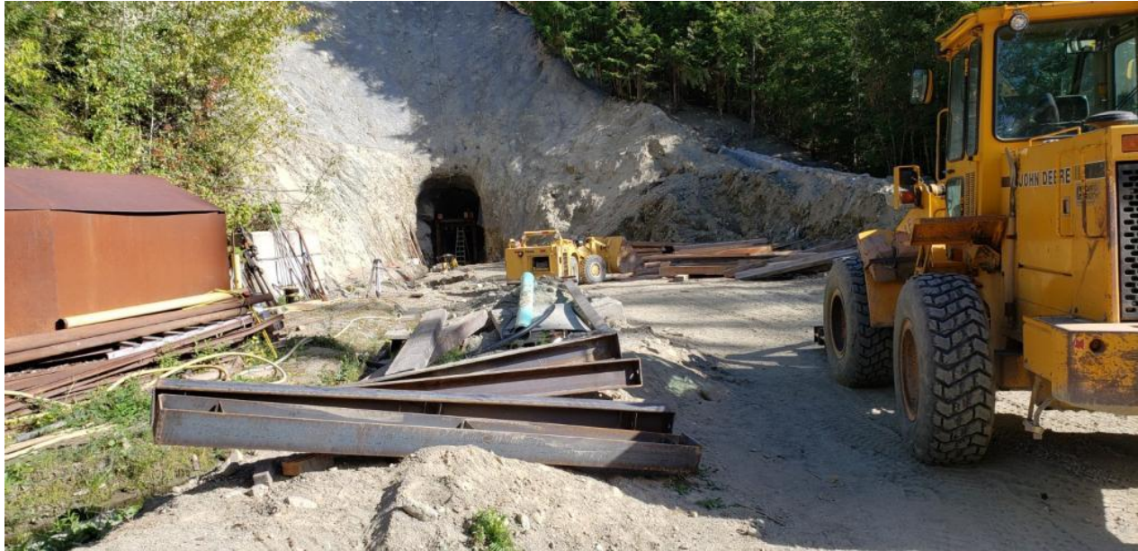
Eingang zur 257-Ebene der Mine Kenville.

Foto der Installation der neuen Stahlgarnituren am 257-Portal bei Kenville, die die ursprünglichen Holzgarnituren ersetzen.