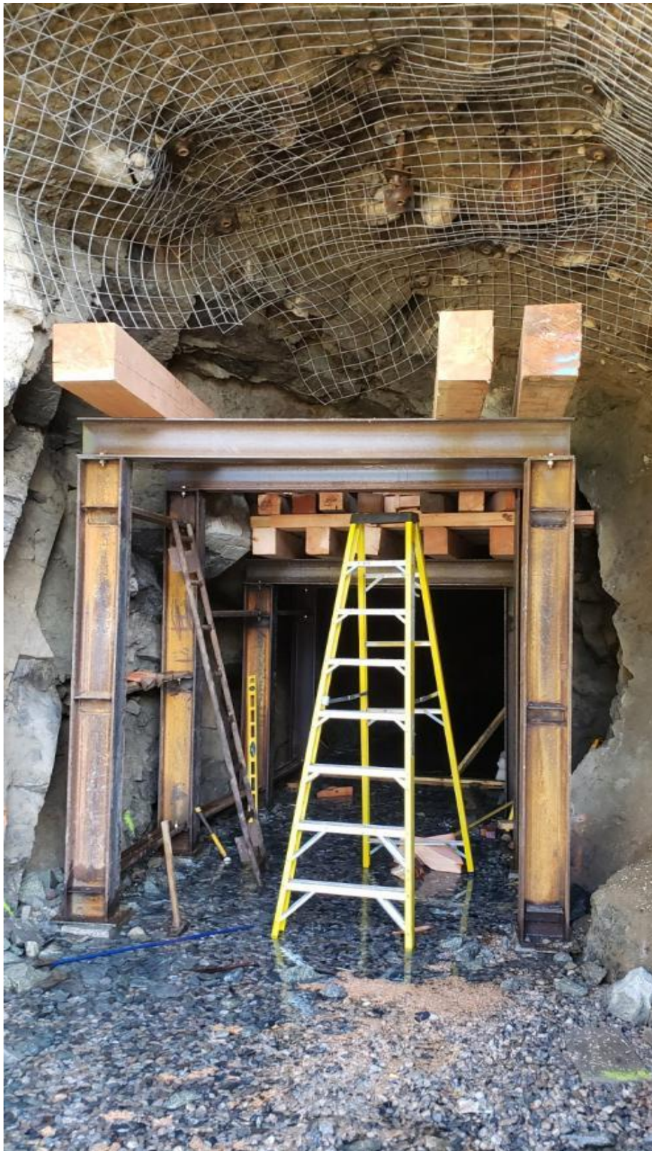
Weiteres Fortschrittsfoto der neuen Stahlgarnituren mit neuen Holzbalken.