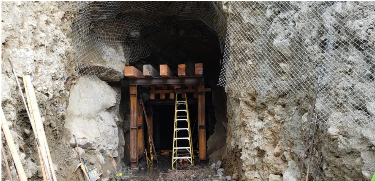
Foto der neuen Stahlgarnituren mit neuen Holzbalken.